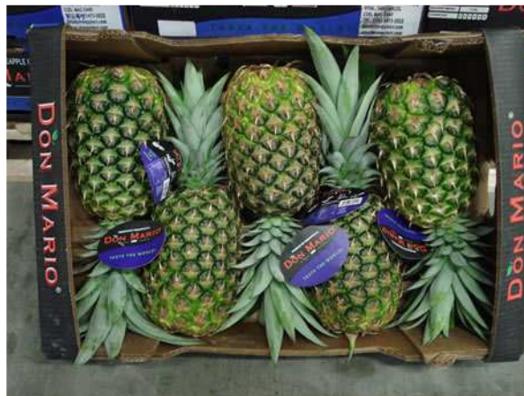
Ananas extra dolci a marchio Don Mario presso l'olandese De Groot International

La quota iraniana nel panorama del mercato mondiale dei pistacchi ha raggiunto il 50% nel 2010, secondo i dati del ministero americano dell'agricoltura. Secondo il rapporto, l'Iran ha esportato un volume di 160.000 ton, buono a soddisfare la metà del mercato mondiale di pistacchio. La Turchia ha esportato..... 0 commenti