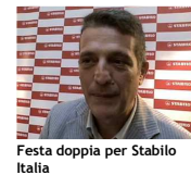
Festa doppia per Stablio Italia