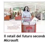
Il retail del futuro secondo Microsoft

IL PARLAMENTO EUROPEO DICE "NO" AGLI OGM